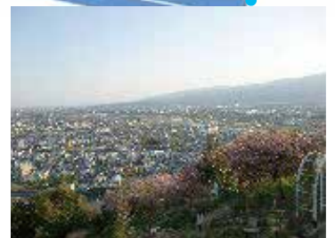
ハーブガーデンよりの眺め